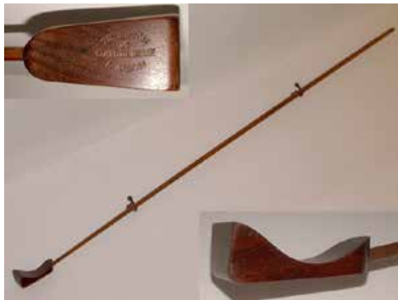
À gauche : Palle-Mail Source : Billards par Jean Marty - Édition du Garde Temps