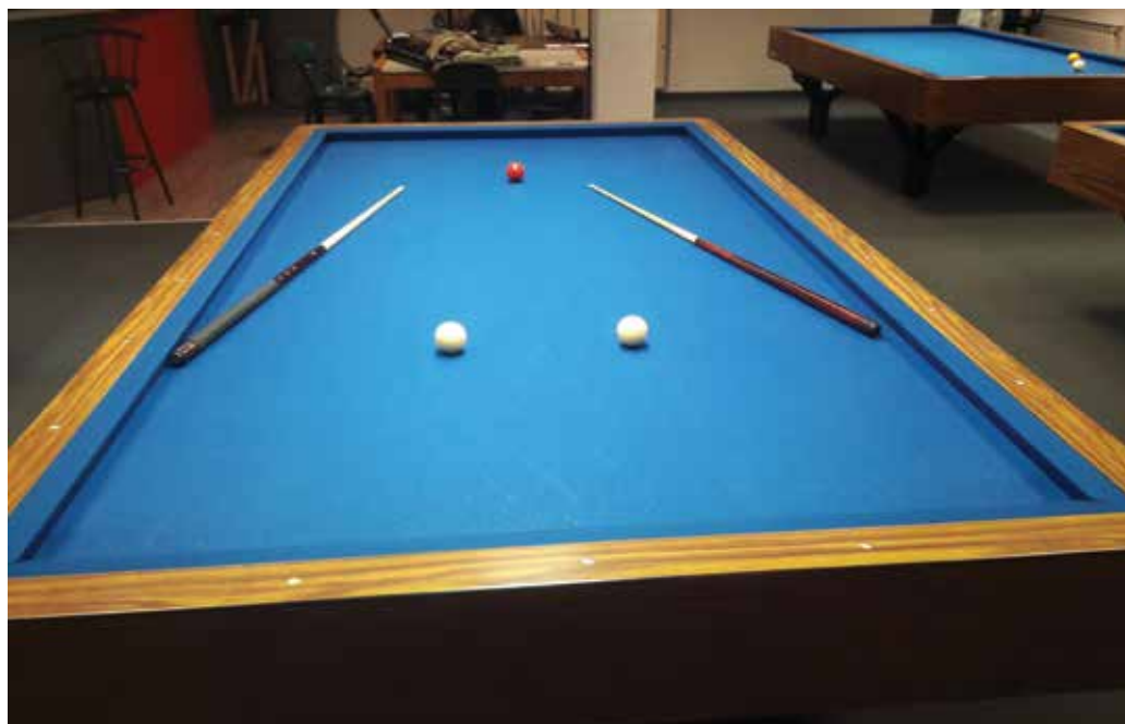
Billard français

Le carambole est un excellent moyen d'entraînement, seul ou à deux, pour toutes les autres disciplines du billard. Les compétitions officielles se déroulent sur des tables de 2,80 m ou 3,10 m, mais les billards sont disponibles dans des dimensions plus petites à partir de 2,10 m.