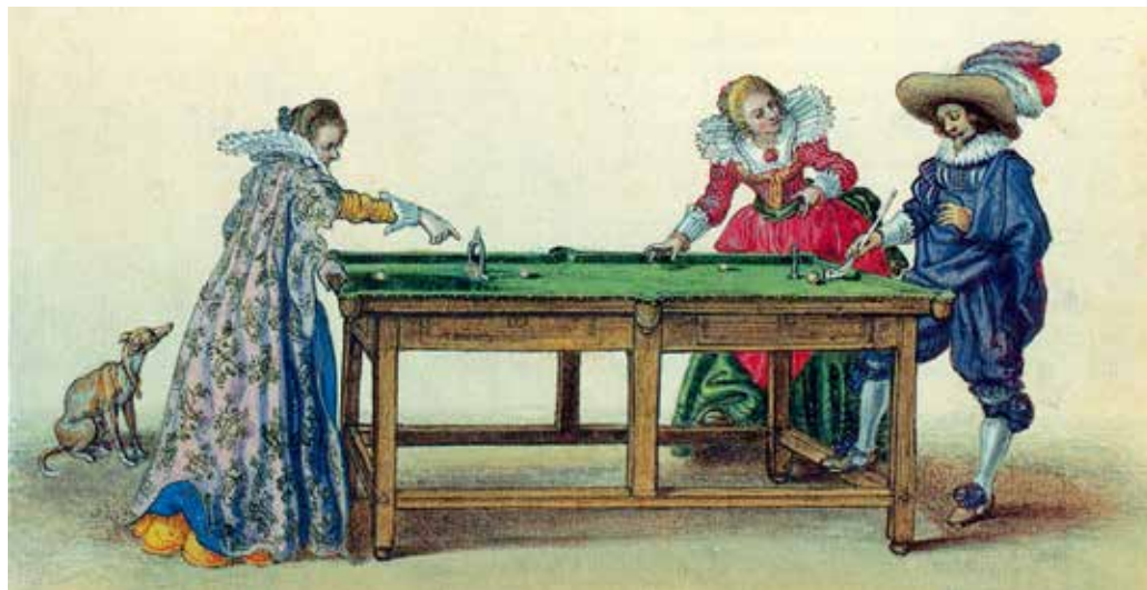
Elizabeth Stuart, Reine de Bohème pointant vers le port, Frederik Henry Prince d'Orange et Amalia van Soms Princesse d'Orange - Adriaen Van de Venne 1620 - British Museum

Cette table comportait une quille (le Roi) et un arceau (le Port). La quille sera remplacée plus tard par une bille rouge.