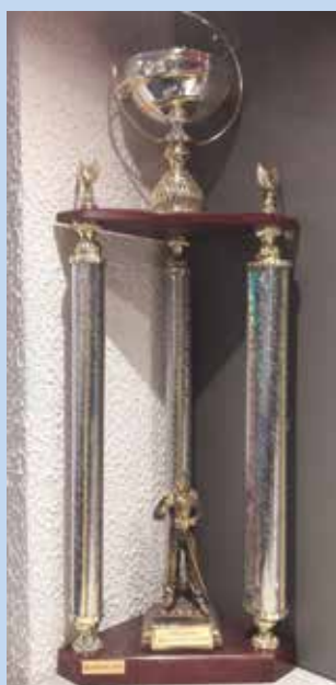
Trophée Challenge Nougailhon détenu par le BBC depuis 2019

Un challenge porte son nom et rassemble les clubs de la région tous les ans. Robert Nougailhon quitte les siens le 11 mars 2007.