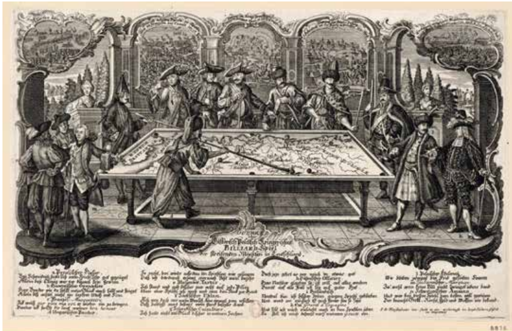
Estampe de J. D. Nessenthaler, gravée par Johann David

Au milieu du XVIII e , le billard est pratiqué dans les académies militaires, pour preuve l'estampe de J. D. Nessenthaler, gravée par Johann David dans les années 1750/1760, montrant les grandes puissances se partageant le monde en jouant à ce jeu.